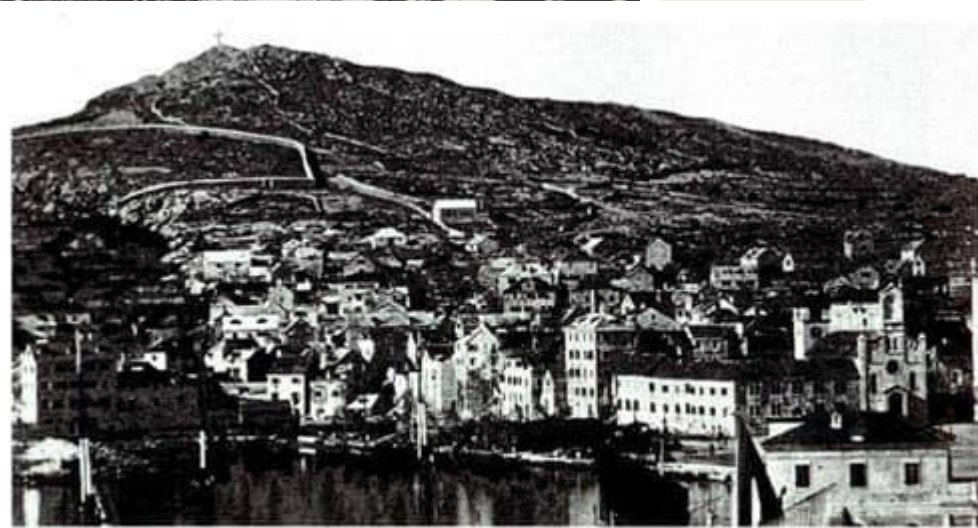
• Istočna strana još nepošumljenog Marjana s križem na najvišem vrhu. Snimljeno oko 1870. godine.