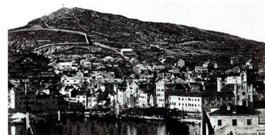
• Istočna strana još nepošumljenog Marjana s križem na najvećem vrhu. Snimljena oko 1870. godine.